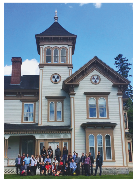
Workshop Appalchen Granit im Butters House (Maison Butters), Stanstead, Quebec, 2018