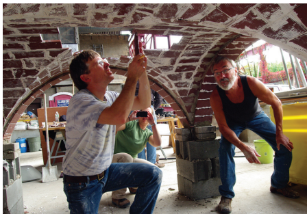
Konstruktion von Tresoren während des praktischen Workshops für den Bau des katalanischen Gewölbes, APTI Annual Congress, 2013, New York