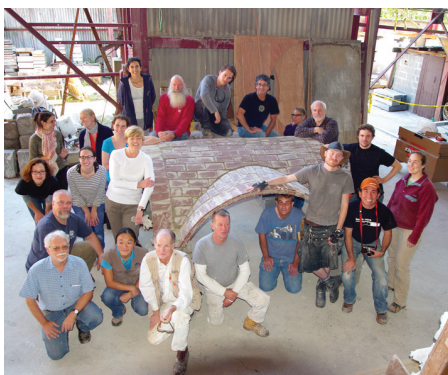
Teilnehmer des praktischen Workshops zum Bau des katalanischen Gewölbes