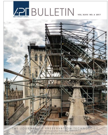
APTI Bulletin: Zeitung der Konservations Technologien

Ausserdem wurde von APT die " Building Technology Heritage Library " (BTHL) entworfen, ein digitales Archiv von nicht katalogisierten Veröffentlichungen zu Thematiken wie "Geschichte der Architektur und Bautechnologien." In diesem Archiv werden Kataloge und andere Veröffentlichungen öffentlicher und privater Institutionen gesammelt. Das Archiv wird regelmäßig mit neuen Materialien aktualisiert und ist in seiner Gesamtheit ohne Urheberrechte verfügbar. Dies ist eine unerschöpfliche Informationsquelle für Architekten, Restauratoren und Vermögensverwalter.